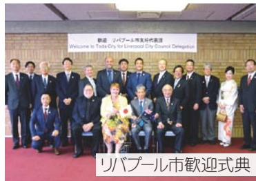
リバプール市歓迎式典