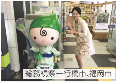
総務視察一行橋市、福岡市

行橋市では庁舎ユニバーサルデザインを、福岡市では庁舎の広場を見学しました。今後、市に対してユニバーサルデザインの推進について提言書を提出します。