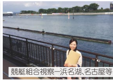
競艇組合視察一浜名湖、名古屋等

行橋市では庁舎ユニバーサルデザインを、福岡市では庁舎の広場を見学しました。今後、市に対してユニバーサルデザインの推進について提言書を提出します。