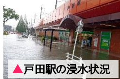
▲戸田駅の浸水状況

こんの 南陵高校前のアンダーパス(地下道)は、非常時は電光掲示板で掲示されるが、常時から注意喚起できるように道路等に標示しては。