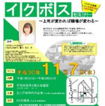
▲戸田市が開催したイクボスセミナー

市長 市民が安心して市政運営を任せられるような職員であり続けるよう、自ら実践する。