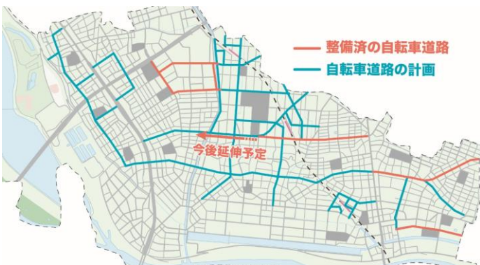
*自転車活用推進計画：安全を確保しつつ、環境や災害、健康増進など他分野に渡る自転車の活用を推進する計画。200の地方自治体での策定を目標としている。

都市整備部長 西側は今年度、北大通りイト前から笹目地区へ整備を予定。今後も延伸する。国道や県道も要望等行い、国道298号や県道新倉蕨線等の整備が実施。