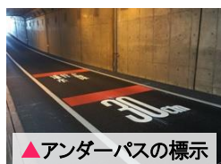
▲アンダーパスの標示