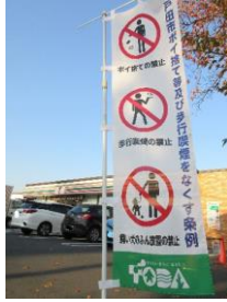
▲駅前コンビニと連携